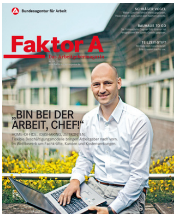
Das Arbeitgebermagazin der Bundesagentur für Arbeit